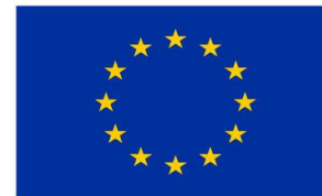
Kaasrahanud Euroopa Liit