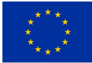
Kaasrahanud Euroopa Liit